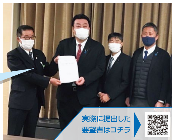
実際に提出した 要望書はコチラ