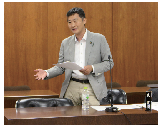
財政総務委員会(9月22日)

〈市民利用施設キャンセルについて〉は、「役所など附設会館の使用料が減額または免除されている団体の直前のキャンセルが3割程度あるため安易な仮押さえや直前のキャンセルがないような工夫をすべき」と要望しました。