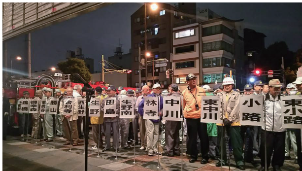
区役所での出発式にて