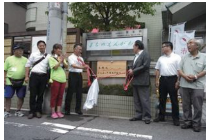
開所式での看板のお披露目

生野区ボランティア・市民活動センターの開所式に行ってきました。とても感慨深かったです。元職場というのがありますが、働いていた当時から市民活動センターの必要性を訴え、なかなか進まないのだから、自ら、NPO法人いくの市民活動支援センターをたち