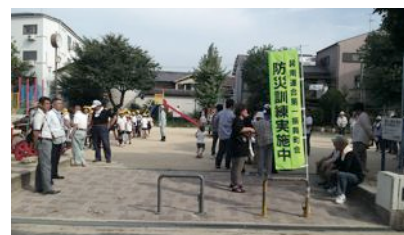
児童と一緒に避難訓練

災害はいつ、どこで起こるかわかりません。日ごろの備えが必要です。そのため、避難所開設訓練が各小学校区で行われています。巽南では、土曜授業と合同でおこない、児童も全員避難するところから参加でした。地域全体の避難訓練としてはなかなか興味深い取り組みで約1,000人の参加をいただきました。