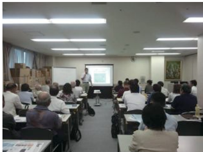
みなさん熱心に受講しています

「呑みに行くだけ!?あなたもできるボランティア」「介護予防・脳の活性化に最適 トレッキングで仲間づくり」「アウトドア満喫ついでに小遣い稼ぎ!素人から始める農業」「開業費用70万円から!の介護ビジネス 介護タクシーを知ろう」の4つのテーマで、それぞれの活動者、経験者の方にお話しいただきました。37名もの参加があり大盛況でした。