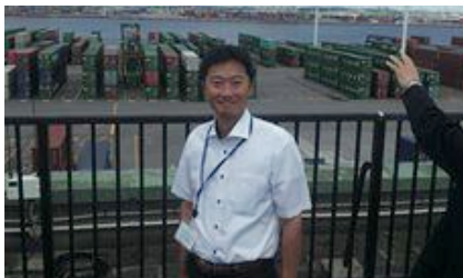
博多港のコンテナターミナル

有意義な視察でした。北九州市では、サバイバルトレーニングセンターにおいてヘリコプターが海に沈んでいくところを想定した訓練の様子。ウォータープラザにおいて海水から水をつくる膜。福岡市では自転車レーン導入の状況説明。博多港のコンテナターミナルの整備状況について。視察に来ると相対的に大阪市の状況を認識できます。こうして各都市が、お互いに切磋琢磨しながら進む側面もまちづくりにはあると実感しました。