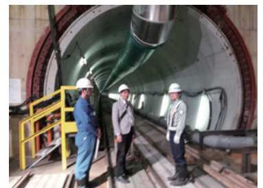
下水道トンネル見学できます!!