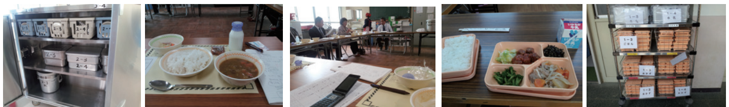
如是中学校の親子方式

会派として、給食の試食も含めた視察を行いました。高槻市では、デリバリー方式での実施でしたが、小学校の調理施設、新設された中学校の調理施設を利用して調理したものを配達する親子方式を今年度から採用しています。生徒にも好評でした。一方、今年度から区の実情に応じて新入生から学年単位または一斉で全員喫食が導入された大阪市では、「常温より冷たい」「量が多い・少ない」「アレルギー対応」など課題が多く生徒にも不評でした。我が会派からは自校方式や高槻市のような親子方式などの導入を提案しています。