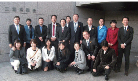
同世代の議員と自主勉強会