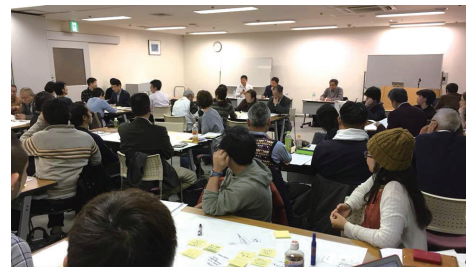
自治フォーラムおおさか