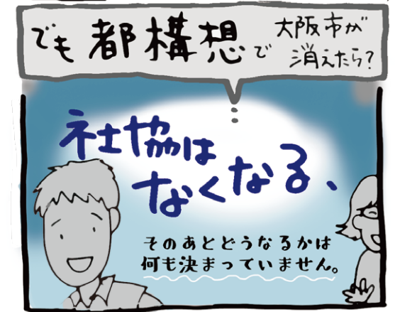
⑧社協さん、どうなっちゃうの...?